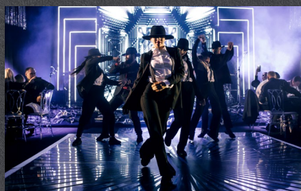
Танцевальное шоу Dance Code – один из самых креативных коллективов страны