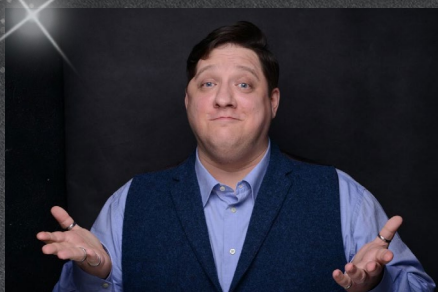
Медийный ведущий Роман Попов (он же Мухич из сериала «Полицейский с Рублёвки»)